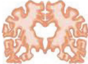
مغز دچار آلزایمر خفیف