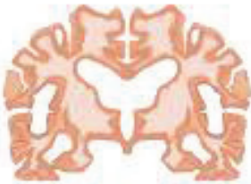
مغز دچار آلزایمر شدید